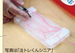
写真は「注トレくんシニア」