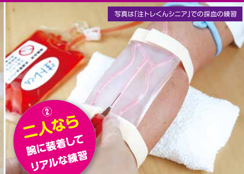
写真は「注トレくんシニア」での採血の練習