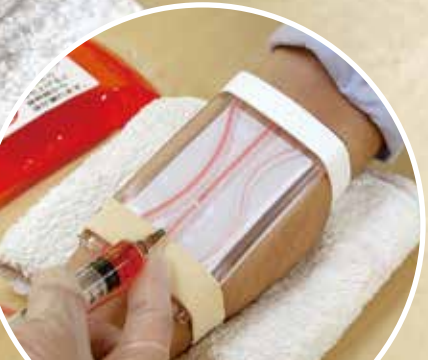
本体「透明版」使用時の様子