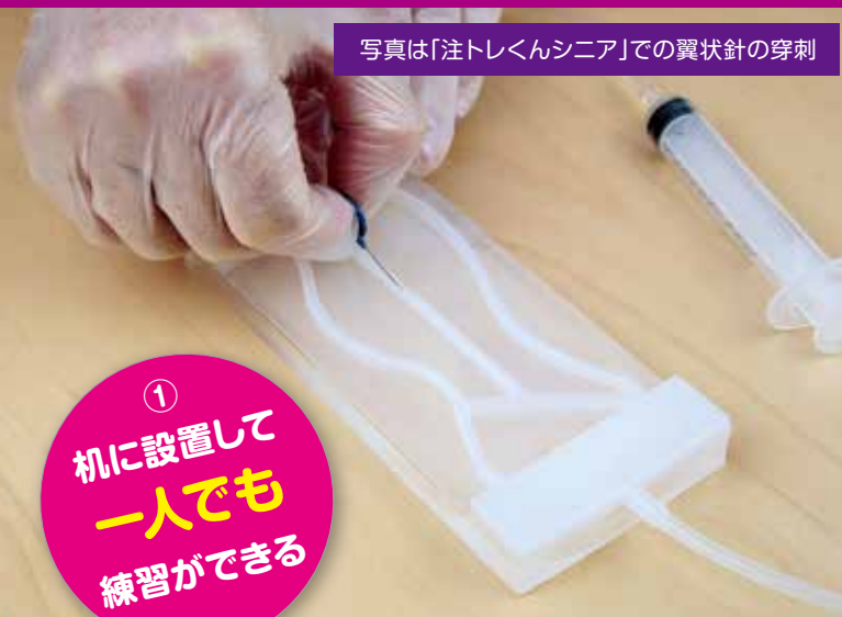
写真は「注トレくんシニア」での翼状針の穿刺