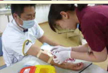
写真中の商品は開発中の試用時のものも含まれます。