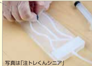
写真は「注トレくんシニア」