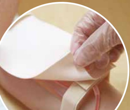
模擬皮膚シート付属でより実践を想定した練習もできる

看護学生、新人ナースの教育現場や、 復職看護師、IVナース研修でも活用いただける 「末梢静脈注射」の練習用教材